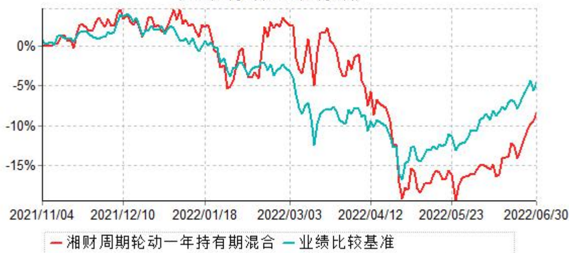
湘财周期轮动一年持有期混合型证券投资基金累计净值增长率与业绩比较基准收益率历史走势对比图 (2021年11月04日-2022年06月30日)

1、本基金合同于2021年11月4日生效，截至本报告期末，本基金基金合同生效未满一年。