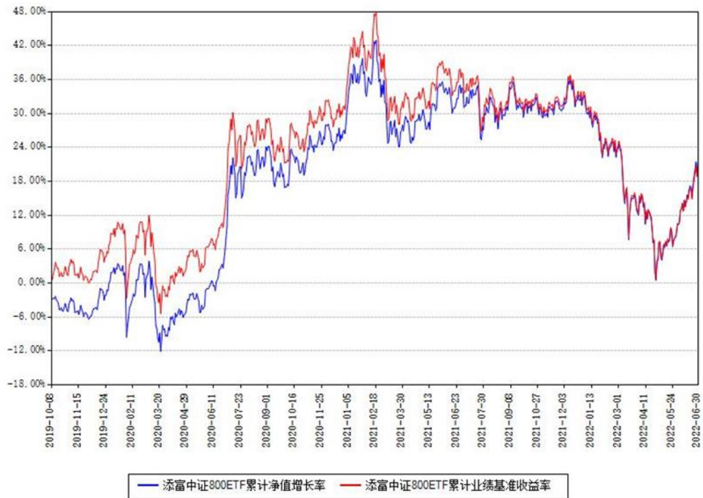
添富中证800ETF累计净值增长率与同期业绩基准收益率对比图