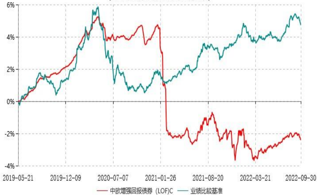
中欧增强回报债券 (LOF)C 累计净值增长率与业绩比较基准收益率历史走势对比图 (2019年05月21日-2022年09月30日)

注：本基金于 2019 年 5 月 20 日新增 C 份额，图示日期为 2019 年 5 月 21 日至 2022 年 09 月 30 日。