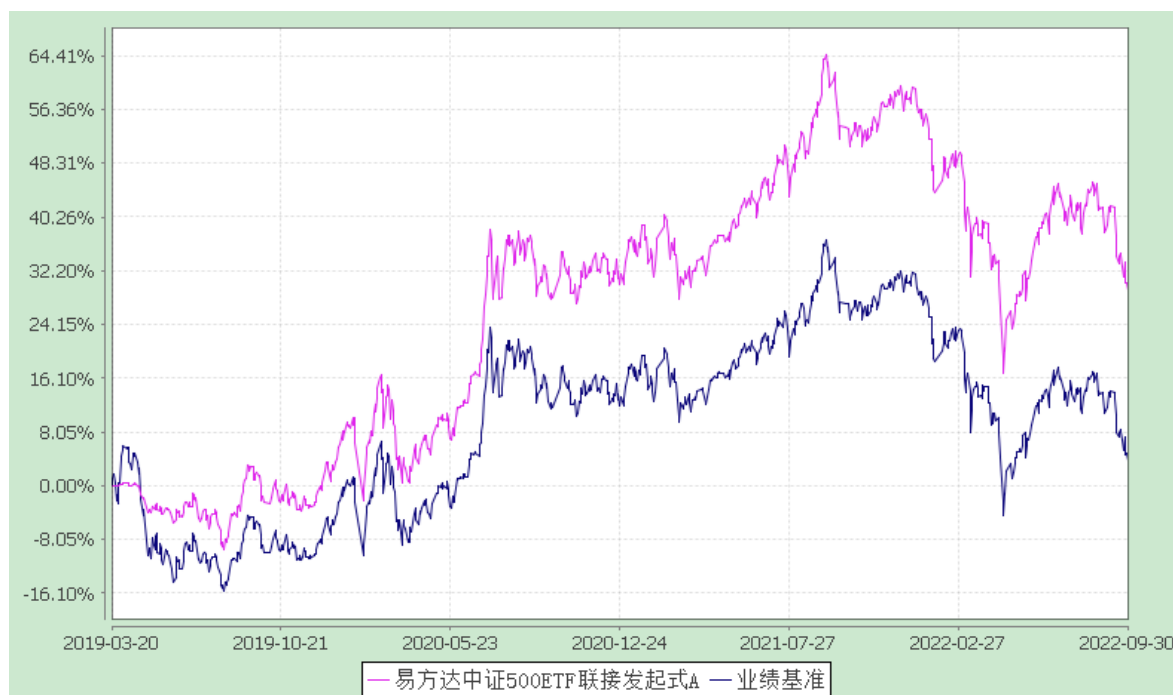
易方达中证 500ETF 联接发起式 C: