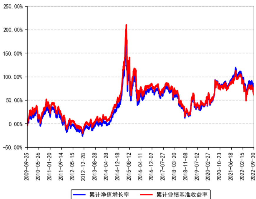
南方中证500ETF联接（LOF）A累计净值增长率与同期业绩比较基准收益率的历史走势对比图