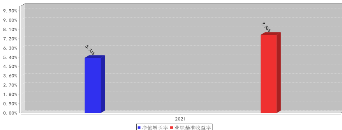
浦银安盛中证证券公司30ETF基金每年净值增长率与同期业绩比较基准收益率的对比图(2021年12月31日)

注:本基金合同生效日为2021年11月4日,生效当年非完整自然年度,按实际存续期计算。业绩表现截止日期2021年12月31日。基金过往业绩不代表未来表现。