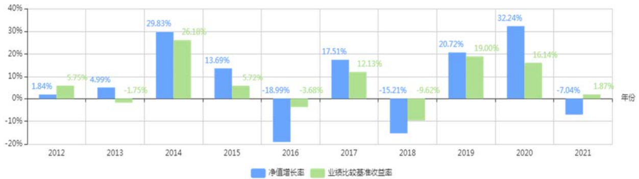
基金每年的净值增长率及与同期业绩比较基准的比较图