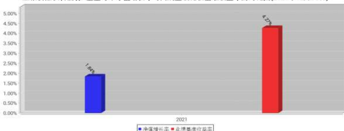
工银食品饮料混合A基金每年净值增长率与同期业绩比较基准收益率的对比图(2021年12月31日)

注:1、本基金基金合同于2021年10月22日生效。合同生效当年不满完整自然年度的,按实际期限计算净值增长率。