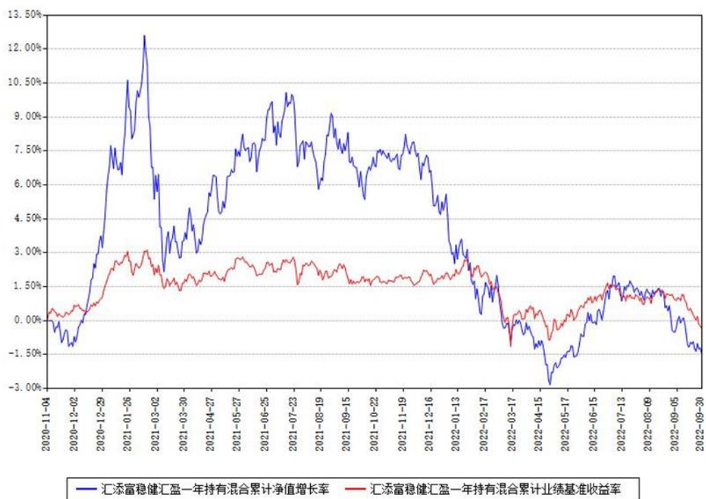
汇添富稳健汇盈一年持有混合累计净值增长率与同期业绩基准收益率对比图