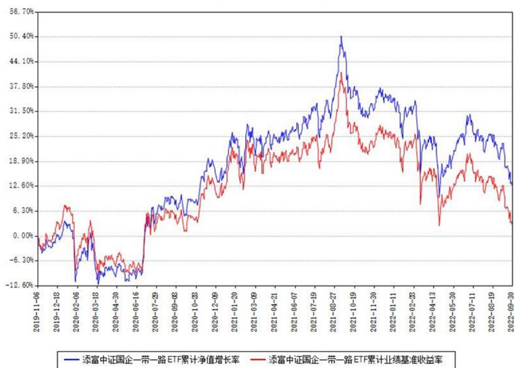
添富中证国企一带一路ETF累计净值增长率与同期业绩基准收益率对比图