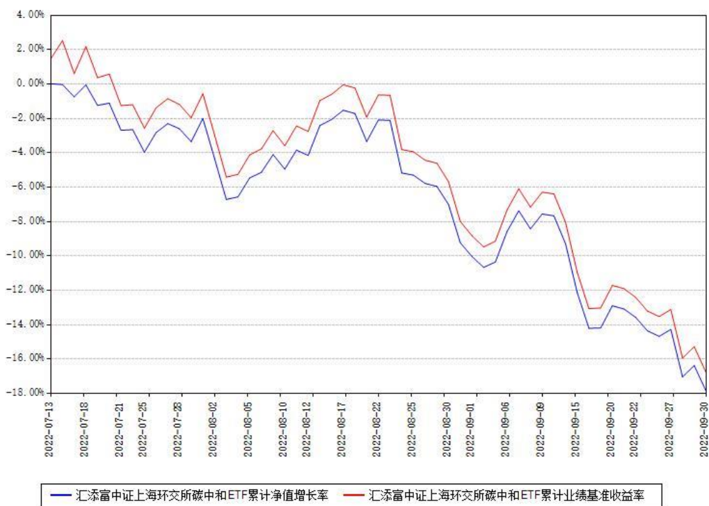
汇添富中证上海环交所碳中和ETF累计净值增长率与同期业绩基准收益率对比图

(二) 自基金合同生效以来基金累计净值增长率变动及其与同期业绩比较基准收益率变动的比较图