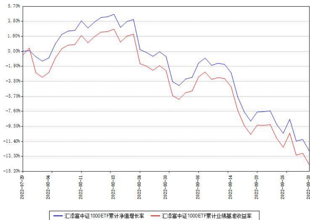
汇添富中证1000ETF累计净值增长率与同期业绩基准收益率对比图

(二) 自基金合同生效以来基金累计净值增长率变动及其与同期业绩比较基准收益率变动的比较图