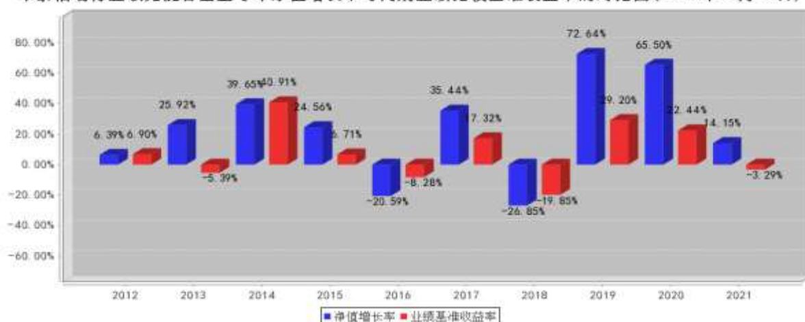
华泰柏瑞行业领先混合基金每年净值增长率与同期业绩比较基准收益率的对比图(2021年12月31日)

注：业绩表现截止日期 2021 年 12 月 31 日。基金过往业绩不代表未来表现。