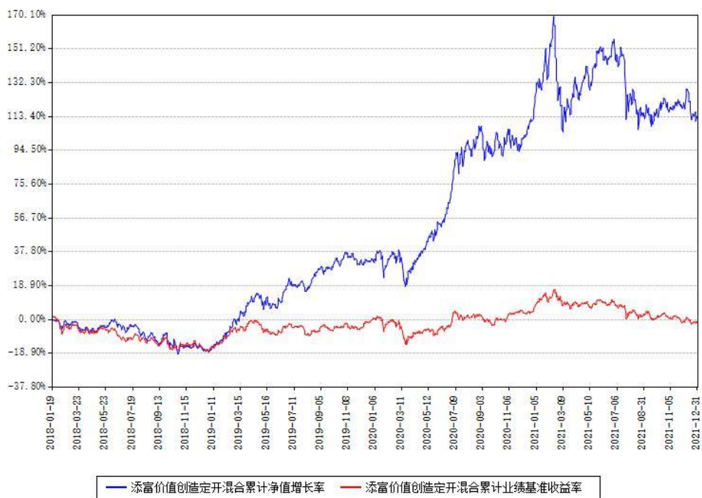
添富价值创造定开混合累计净值增长率与同期业绩基准收益率对比图