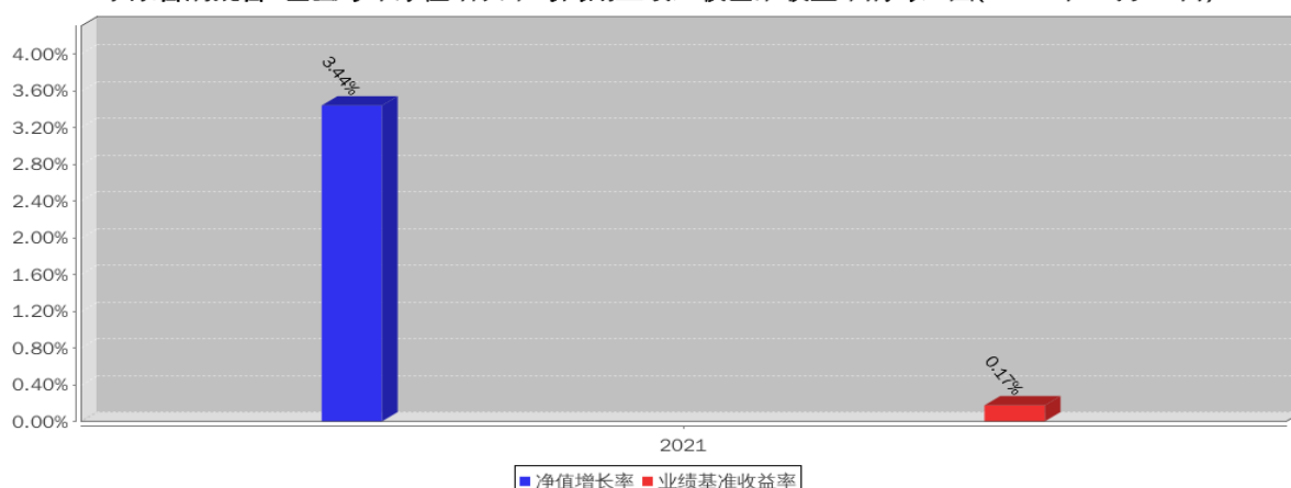
泰康合润混合A基金每年净值增长率与同期业绩比较基准收益率的对比图(2021年12月31日)

注:本基金成立于 2021 年 4 月 7 日, 2021 年度相关数据的计算期间为 2021 年 4 月 7 日至 2021 年 12 月 31 日, 图示业绩表现截止日期 2021 年 12 月 31 日。基金过往业绩不代表未来表现。