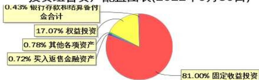
投资组合资产配置图表(2022年9月30日)

● 固定收益投资 ● 买入返售金融资产 ● 其他各项资产 ● 权益投资 ● 银行存款和结算备付金合计