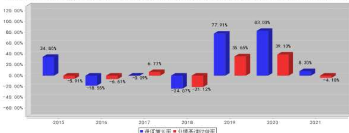
华泰柏瑞消费成长混合基金每年净值增长率与同期业绩比较基准收益率的对比图(2021年12月31日)

注：业绩表现截止日期 2021 年 12 月 31 日。基金过往业绩不代表未来表现。