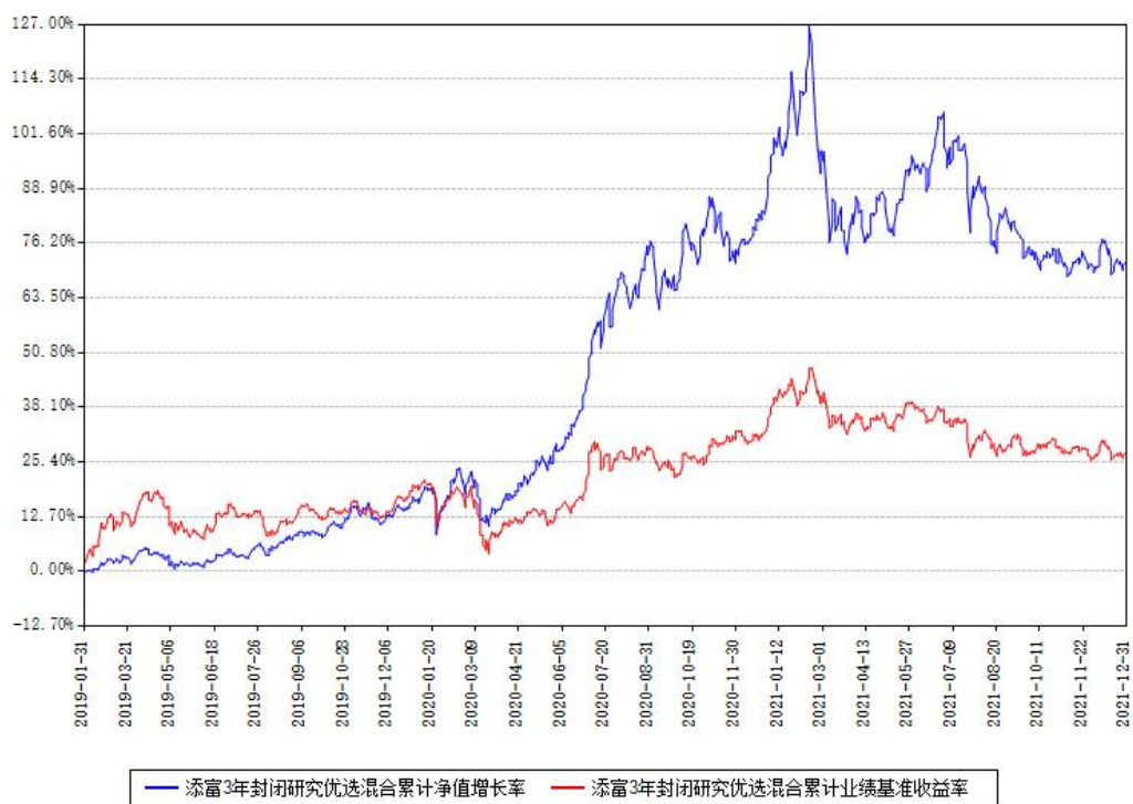
添富3年封闭研究优选混合累计净值增长率与同期业绩基准收益率对比图

注：汇添富3年封闭运作研究优选灵活配置混合型证券投资基金自2022年2月7日起转为开放式运作，基金名称变更为“汇添富研究优选灵活配置混合型证券投资基金”。上述图表为本次转型前的业绩数据。