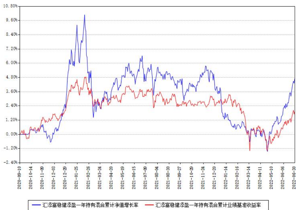
汇添富稳健添盈一年持有混合累计净值增长率与同期业绩基准收益率对比图