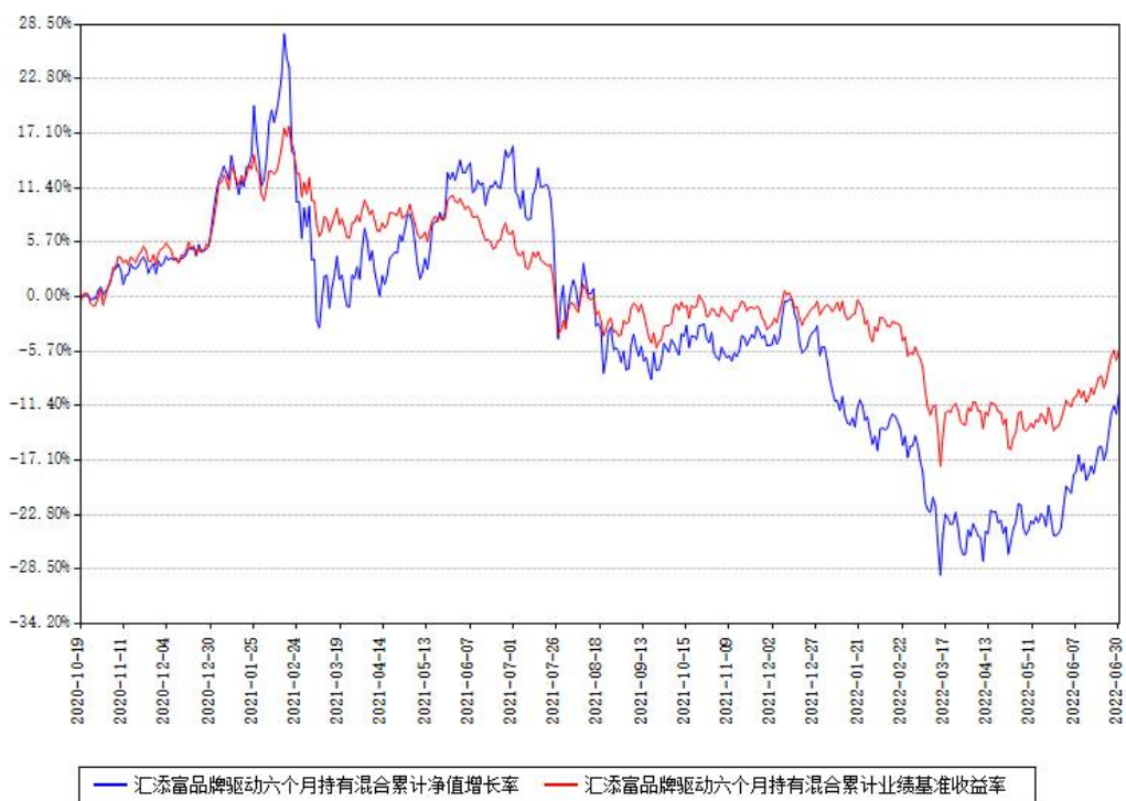
汇添富品牌驱动六个月持有混合累计净值增长率与同期业绩基准收益率对比图