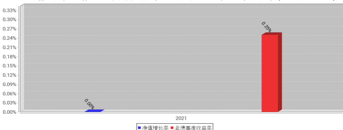
工银民瑞一年持有混合A基金每年净值增长率与同期业绩比较基准收益率的对比图(2021年12月31日)

注:1、本基金合同生效日为2021年12月28日,合同生效当年不满完整自然年度的,按实际期限计算净值增长率。