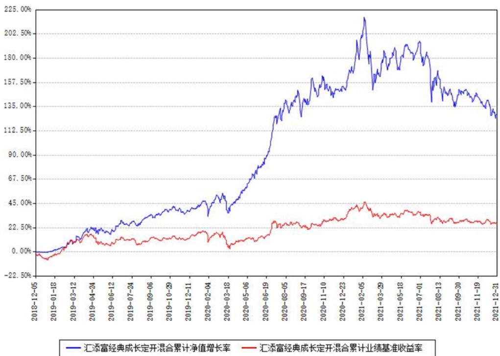
汇添富经典成长定开混合累计净值增长率与同期业绩基准收益率对比图