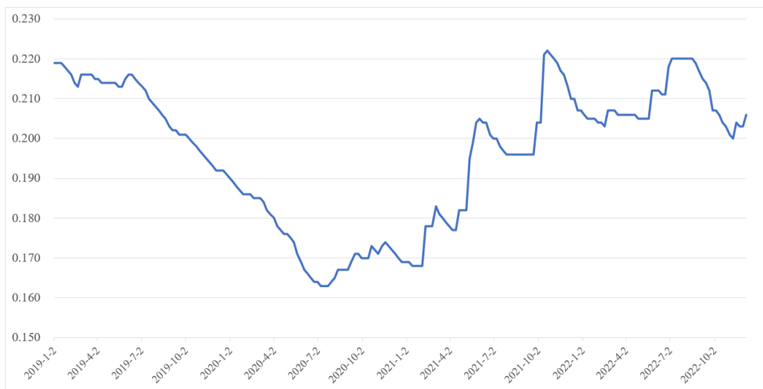
2019 年 1 月-2022 年 11 月晶硅光伏组件价格走势（美元/W）

光伏组件是光伏电站的核心设备之一，其成本占光伏电站投资成本比重较大。近年来，在光伏产业技术水平持续快速进步的推动下，光伏组件价格快速下降，光伏发电成本步入快速下降通道。自 2020 年 7 月以来，受上游多晶硅等原材料出现供需错配、价格快速上涨影响，光伏组件价格同步走高。2019 年 1 月至 2022 年 11 月，晶硅光伏组件价格走势如下：