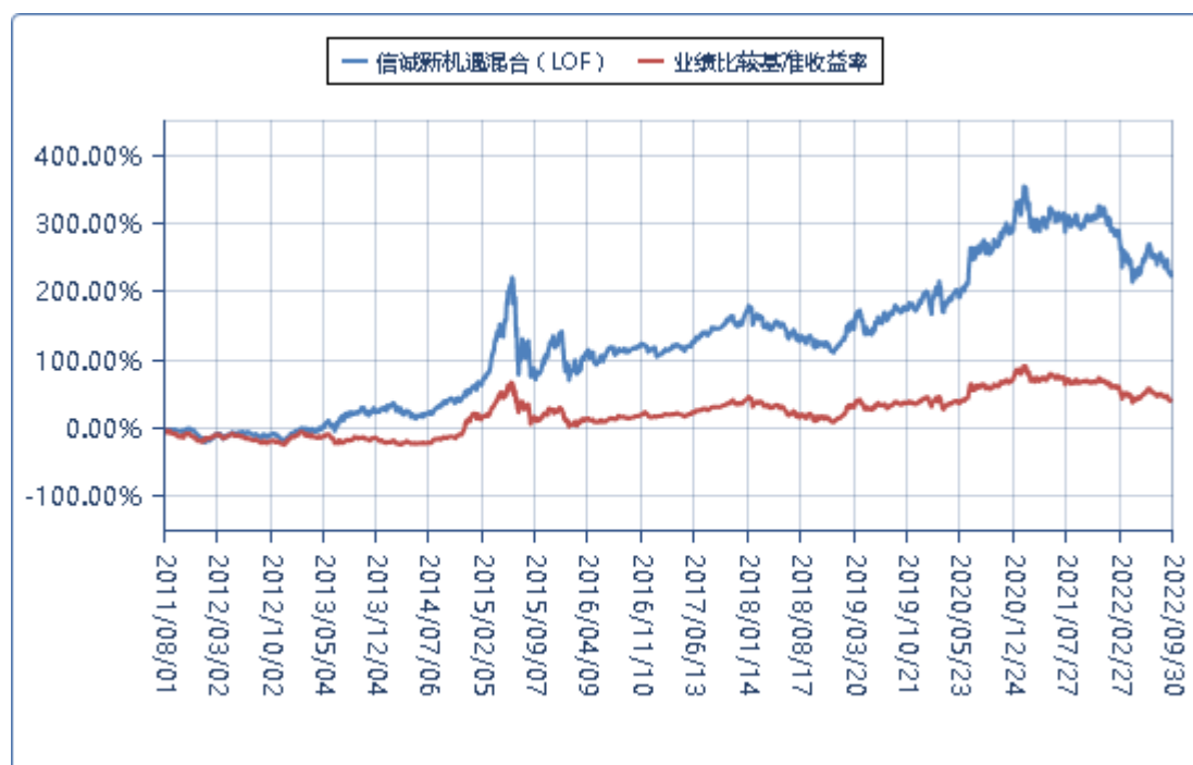
(二) 基金累计净值增长率与业绩比较基准收益率的历史走势对比图