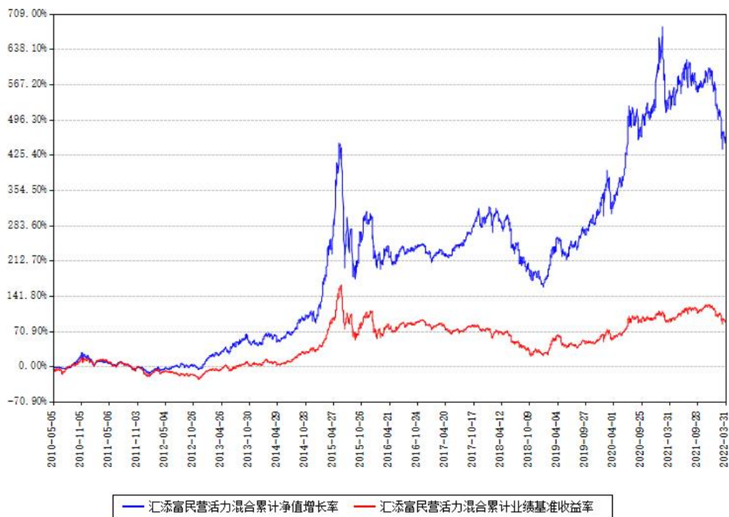
汇添富民营活力混合累计净值增长率与同期业绩基准收益率对比图