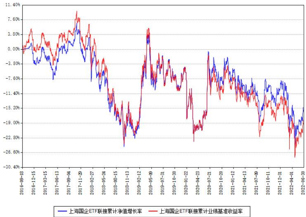
上海国企ETF联接累计净值增长率与同期业绩基准收益率对比图