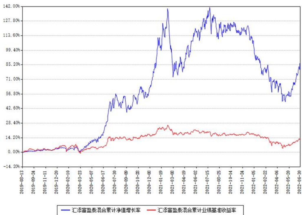
汇添富盈泰混合累计净值增长率与同期业绩基准收益率对比图