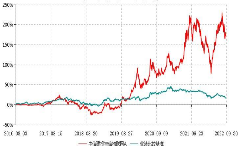
中信建投智信物联网A累计净值增长率与业绩比较基准收益率历史走势对比图 (2016年08月03日-2022年09月30日)