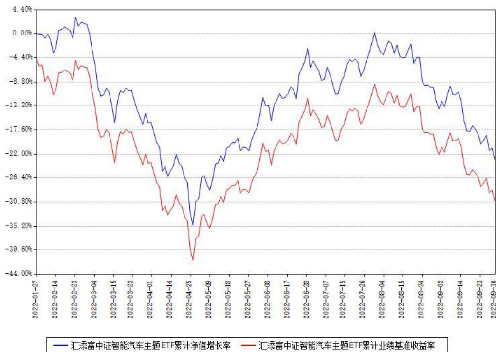
汇添富中证智能汽车主题ETF累计净值增长率与同期业绩基准收益率对比图

(二) 自基金合同生效以来基金累计净值增长率变动及其与同期业绩比较基准收益率变动的比较