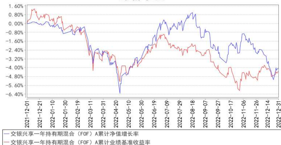
交银兴享一年持有期混合（FOF）A 累计净值增长率与同期业绩比较基准收益率的历史走势对比图