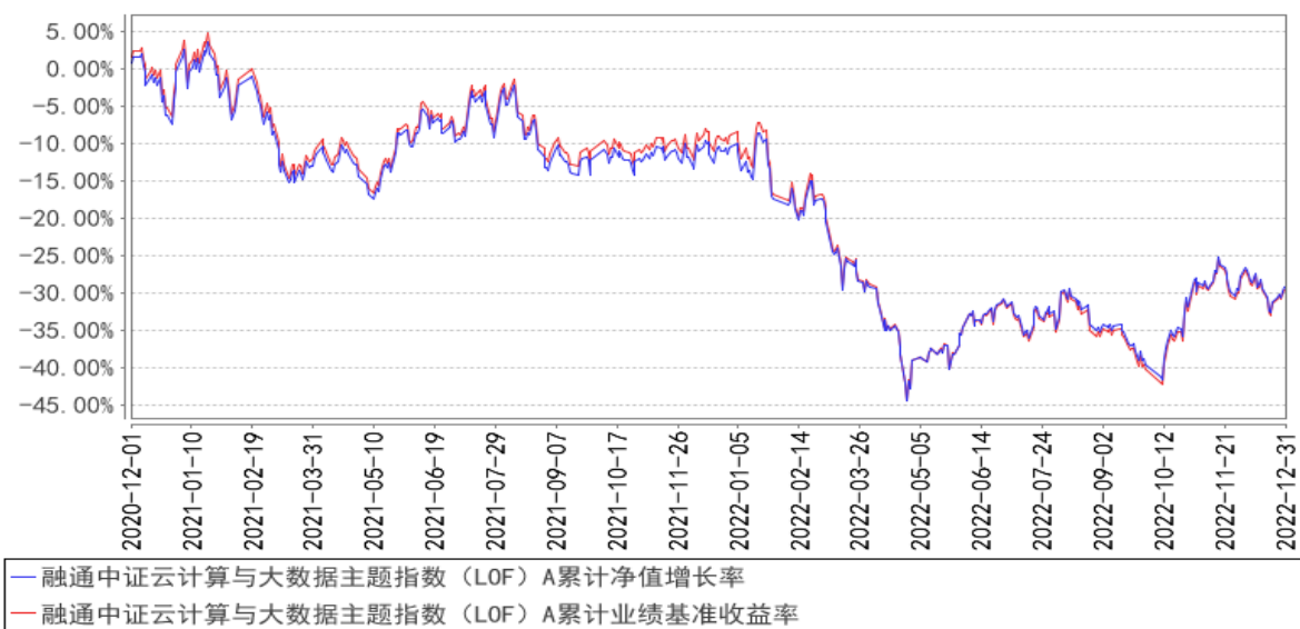
融通中证云计算与大数据主题指数（LOF）A 累计净值增长率与同期业绩比较基准收益率的历史走势对比图