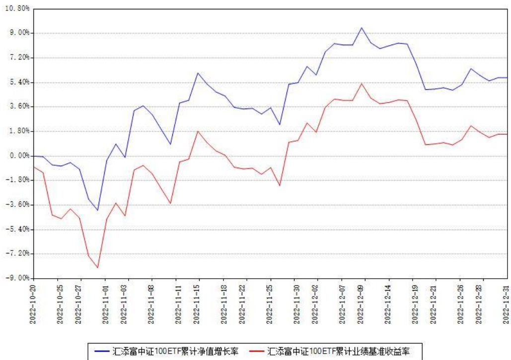
汇添富中证100ETF累计净值增长率与同期业绩基准收益率对比图