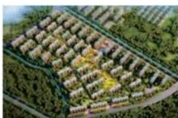
| 南京中骏原瑞阁装配式项目(PC)