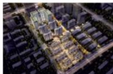
| 武汉蔡甸中法之星一期装配式项目(PC)