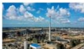
中科(广东)炼化一体化项目