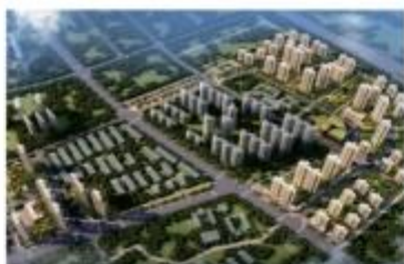
| 武汉蔡甸中法生态城新天地还建设区装配式项目(PC)