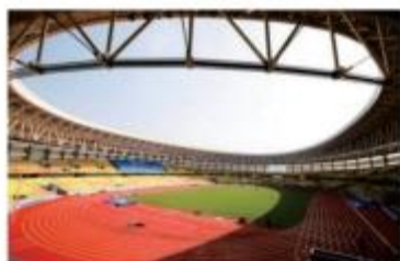
| 武汉东西湖五环体育馆预制清水看台板项目