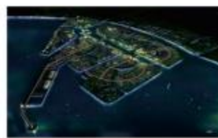
山东裕龙石化项目