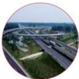
| 阜源高速公路建湖至兴化段