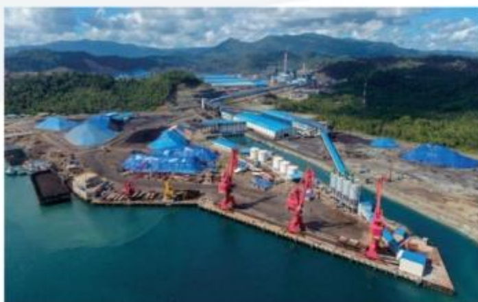
▲ 印尼宾坦南山工业园项目