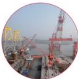
| 江苏海新船务重工有限公司轨道安装项目