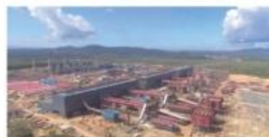
▲ 印尼苏拉威西岛莫罗瓦里县镍铁厂