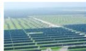
国家光伏·储能实证实验平台(大庆基地)一期工程项目