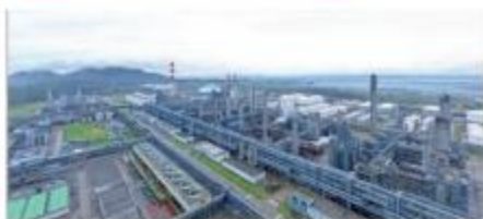
福建古雷炼化一体化项目