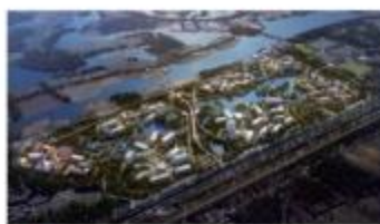
华为上海青浦研发生产项目