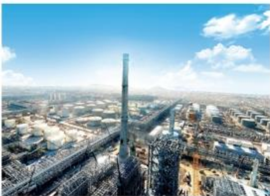
浙石化年产4000万吨炼化一体化项目