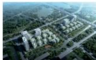
上海宝山MAX科技园项目