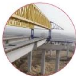
| 徽州大道南延工程(庐江段)