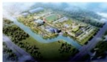
太仓市城东水质净化厂项目