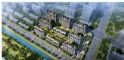
灌云万达广场泰达城