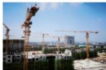
| 南京熙园府装配式项目(PC)