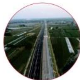
| 京沪高速改扩建 Sy4标