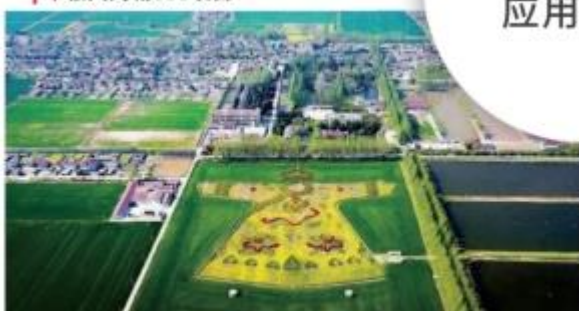
丨 中铁六合龙袍新城项目