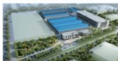
▲ 印尼三宝壟PVC管厂房建设开发项目