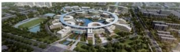
西交利物浦大学太仓校区项目