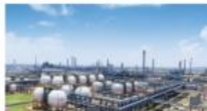
盛虹炼化一体化项目