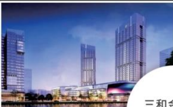
丨 中粮大悦城G53项目