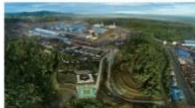
▲ 印尼青山铝业工业园