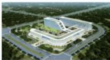
苏州市妇幼保健院项目