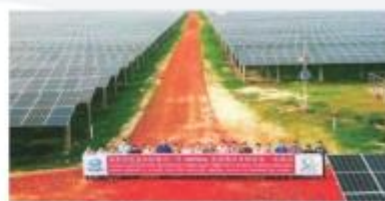
▲ 孟加拉国迈门辛市50MWac光伏项目