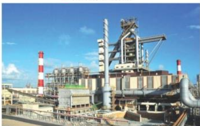
▲ 越南台望河静1、2号高炉