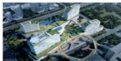
盐城市第一人民医院二期及医疗综合体