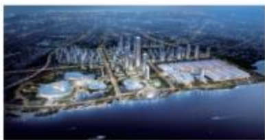
厦门新会展中心体育中心