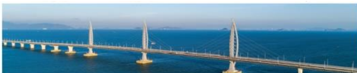
| 港珠澳大桥工程项目