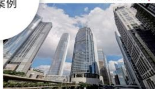
越秀地产雨花95亩G40项目 |