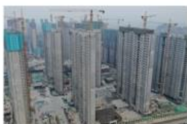
| 招商东望府装配式项目(PC)