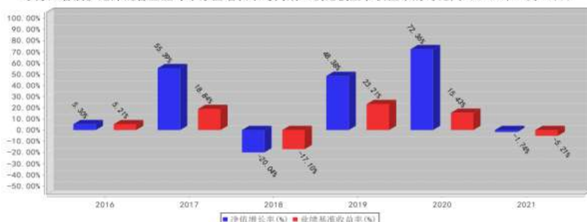
东方红睿满沪港深混合基金每年净值增长率与同期业绩比较基准收益率的对比图（2021年12月31日）