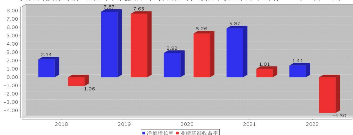
安信永鑫增强债券A基金每年净值增长率与同期业绩比较基准收益率的对比图(2022年12月31日)

注:基金合同生效当年期间的相关数据按实际存续期计算。基金的过往业绩并不代表其未来表现。本基金由安信永鑫定期开放债券型证券投资基金变更注册而来。根据2018年5月14日基金份额持有人大会决议,自2018年6月12日起,《安信永鑫增强债券型证券投资基金基金合同》生效,《安信永鑫定期开放债券型证券投资基金基金合同》同一日起失效。