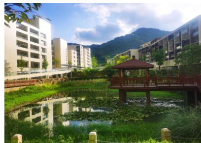
温州东方悦心中等职业技术学校