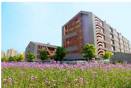
上海奉贤金海悦心颐养院

依托于悦心照护体系的完善和专业团队的壮大，“悦心·漫活欣成”、“悦心·安颐别业”、“悦心照护教育培训”三个产品线，互相支持、互为依托，形成齐头并进的发展态势。