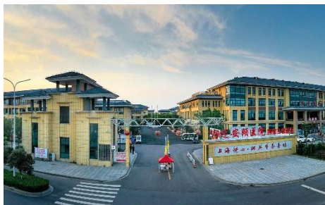
上海悦心·泗洪康养中心