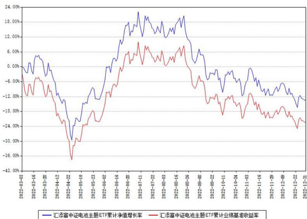
汇添富中证电池主题ETF累计净值增长率与同期业绩基准收益率对比图

(二) 自基金合同生效以来基金累计净值增长率变动及其与同期业绩比较基准收益率变动的比较图