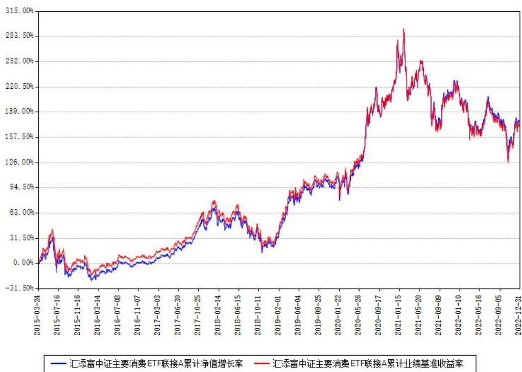
汇添富中证主要消费ETF联接A累计净值增长率与同期业绩基准收益率对比图

(二) 自基金合同生效以来基金累计净值增长率变动及其与同期业绩比较基准收益率变动的比较图