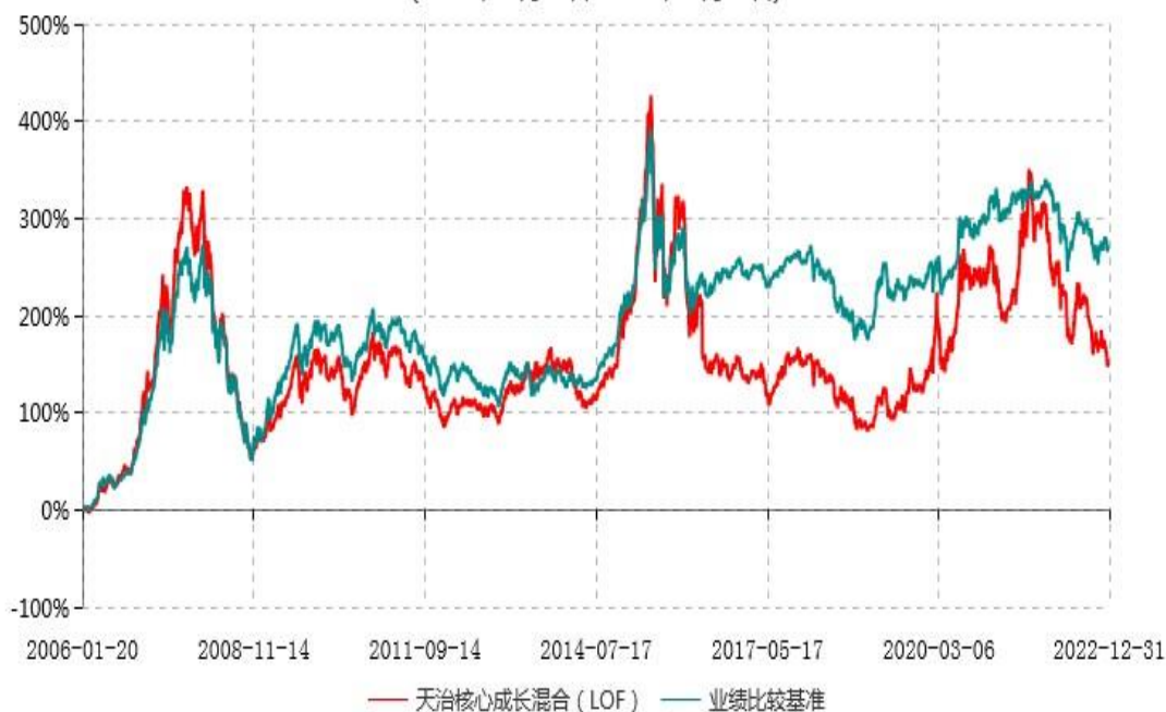
天治核心成长混合型证券投资基金（LOF）累计净值增长率与业绩比较基准收益率历史走势对比图 (2006年01月20日-2022年12月31日)