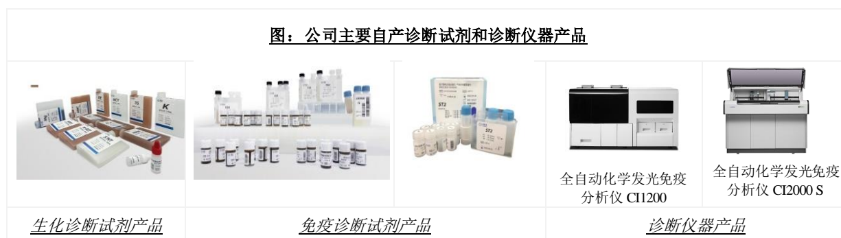
图：公司主要自产诊断试剂和诊断仪器产品

公司在生物化学原料领域产品包括生物酶、辅酶、抗原、抗体、精细化学品等各种试剂，应用范围涵盖生物科技、临床诊断和化工生产等多个方面。公司是国内极少数掌握诊断酶制备技术的诊断试剂生产企业之一。全资子公司阿匹斯通过借助利德曼多年积累的体外诊断行业渠道、国内各级医疗机构以及科研机构资源，可以服务于体外诊断、临床诊断与医疗、生命科学、食品检测等专业领域的企业、大学、科研院所。