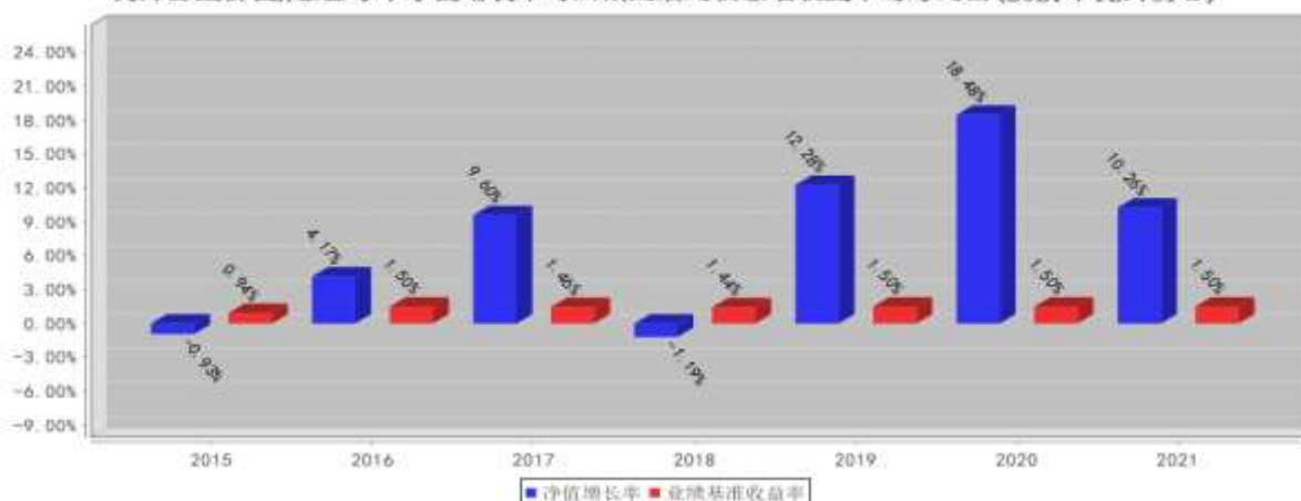
德邦鑫星价值A基金每年净值增长率与同期业绩比较基准收益率的对比图 (2021年12月31日)

注: 业绩表现截止日期 2021 年 12 月 31 日。基金过往业绩不代表未来表现。