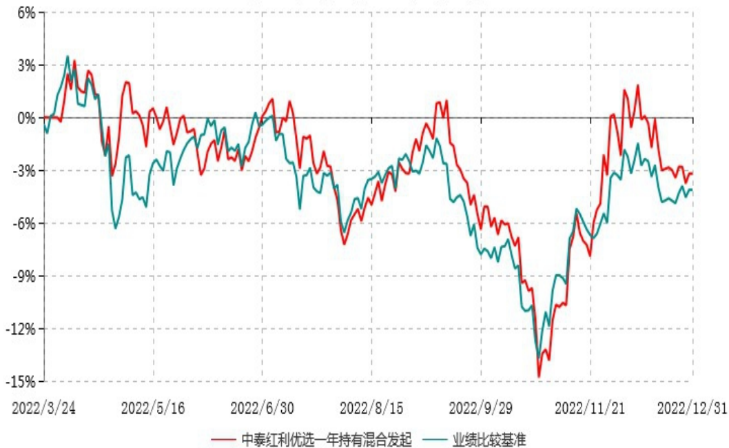
中泰红利优选一年持有期混合型发起式证券投资基金累计净值增长率与业绩比较基准收益率历史走势对比图 (2022年03月24日-2022年12月31日)