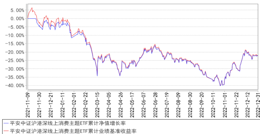
平安中证沪港深线上消费主题ETF累计净值增长率与同期业绩比较基准收益率的历史走势对比图