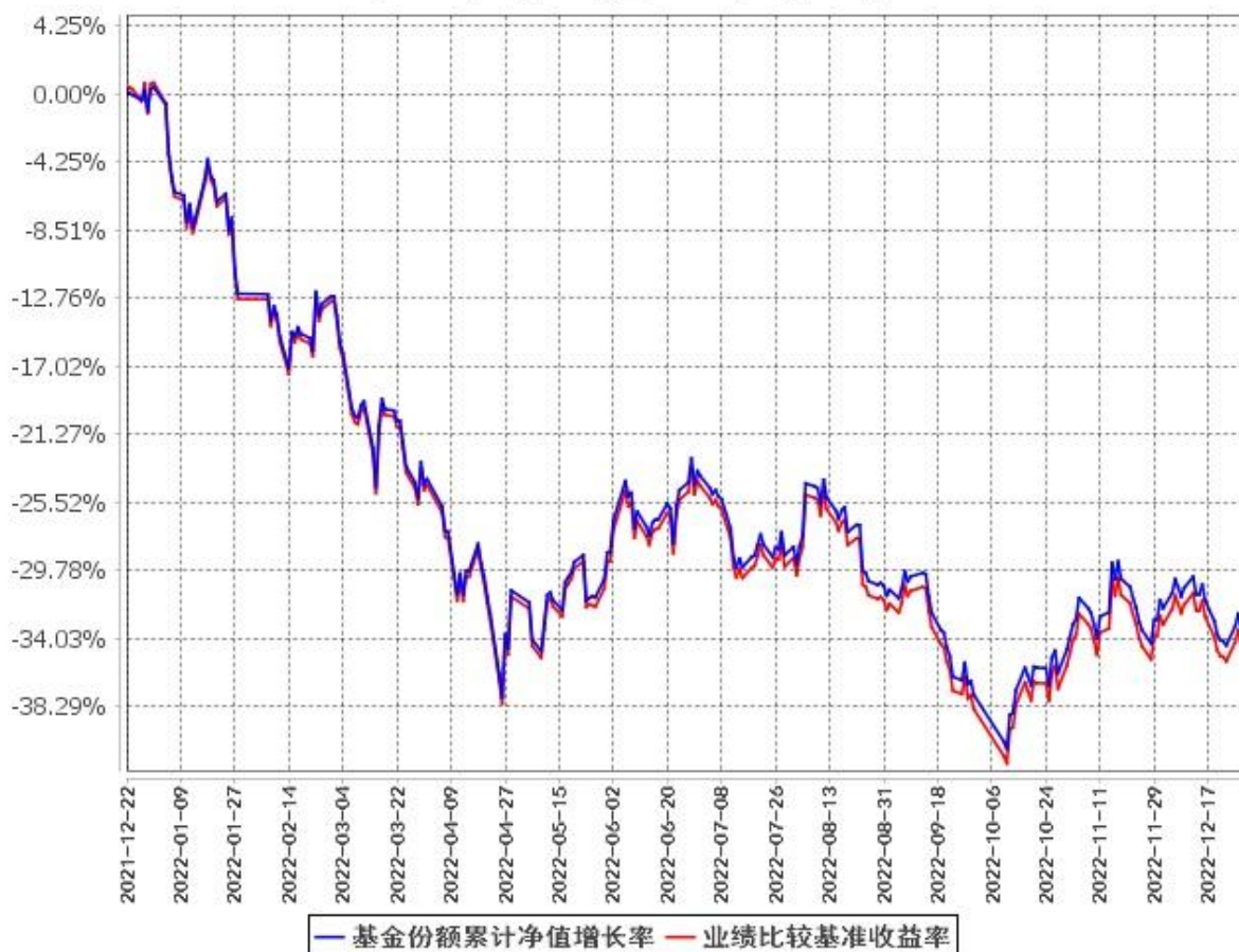
基金份额累计净值增长率与同期业绩比较基准收益率的历史走势对比图 (2021年12月22日至2022年12月31日)

注：按基金合同规定，本基金的建仓期为自基金合同生效之日起 6 个月。建仓期结束时，本基金的投资组合比例符合本基金合同的有关规定。