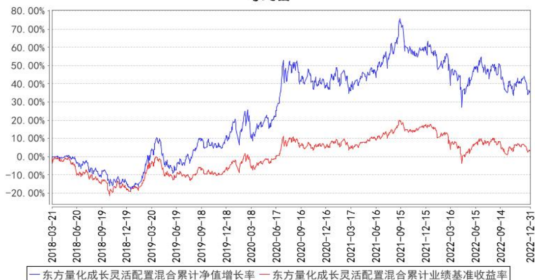
东方量化成长灵活配置混合累计净值增长率与同期业绩比较基准收益率的历史走势对比图