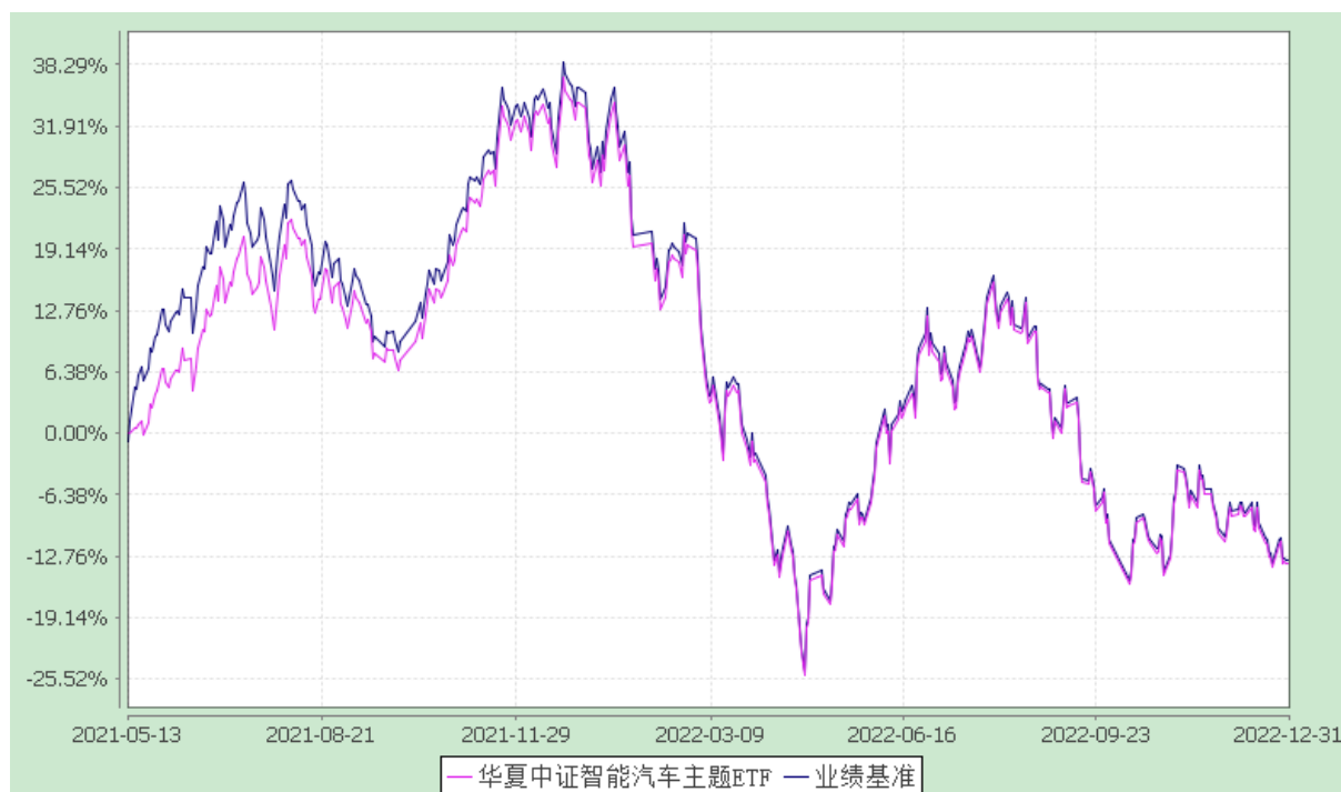
华夏中证智能汽车主题交易型开放式指数证券投资基金 份额累计净值增长率与业绩比较基准收益率历史走势对比图 (2021 年 5 月 13 日至 2022 年 12 月 31 日)