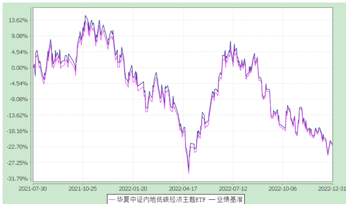
华夏中证内地低碳经济主题交易型开放式指数证券投资基金 份额累计净值增长率与业绩比较基准收益率历史走势对比图 (2021 年 7 月 30 日至 2022 年 12 月 31 日)

注：根据本基金的基金合同规定，本基金自基金合同生效之日起 6 个月内使基金的投资组合比例符合本基金合同中投资范围、投资限制的有关约定。