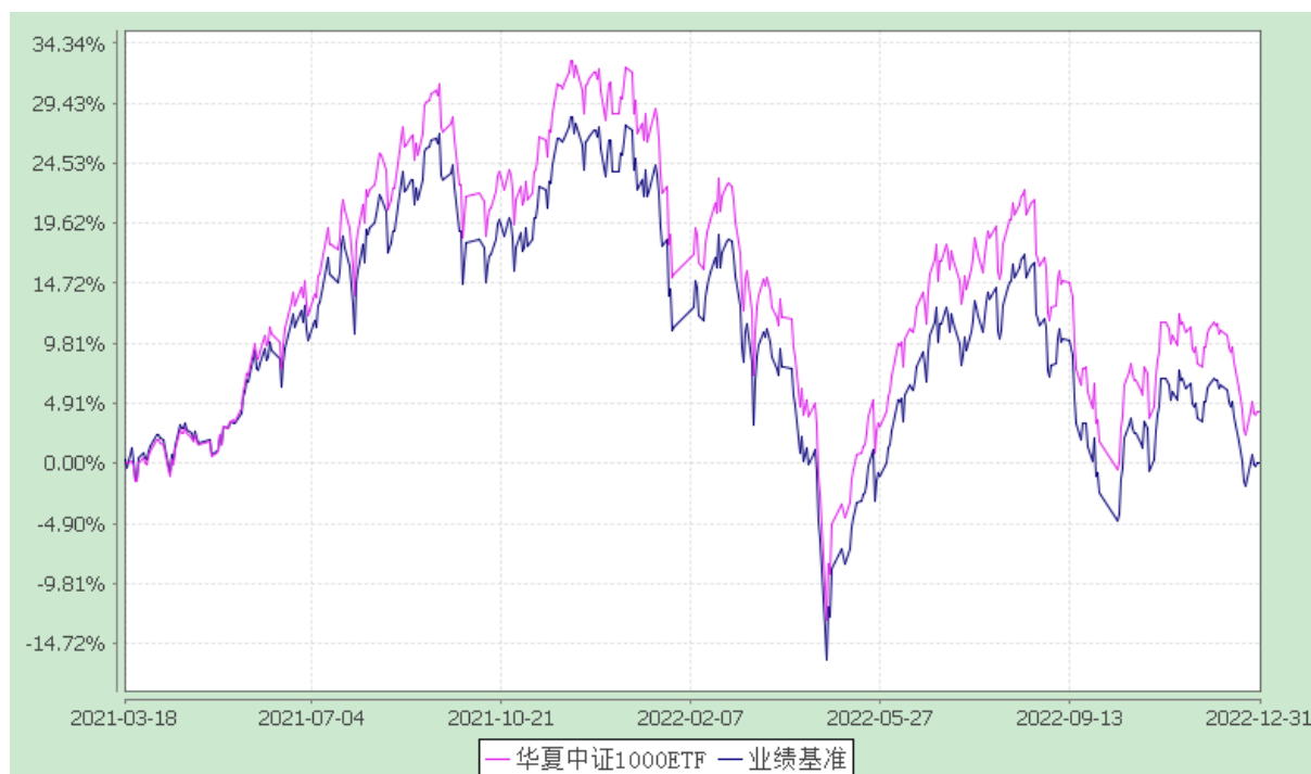
华夏中证 1000 交易型开放式指数证券投资基金 份额累计净值增长率与业绩比较基准收益率历史走势对比图 (2021 年 3 月 18 日至 2022 年 12 月 31 日)