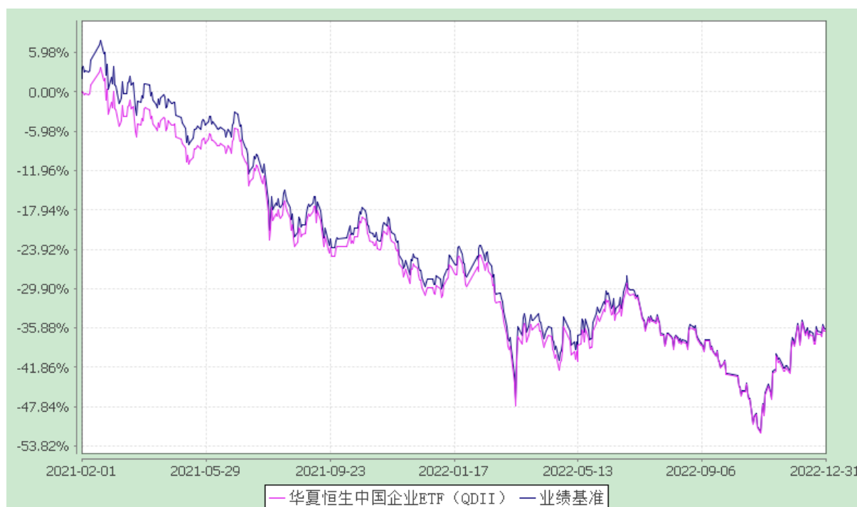
华夏恒生中国企业交易型开放式指数证券投资基金（QDII） 基金份额累计净值增长率与业绩比较基准收益率的历史走势对比图 (2021年2月1日至2022年12月31日)