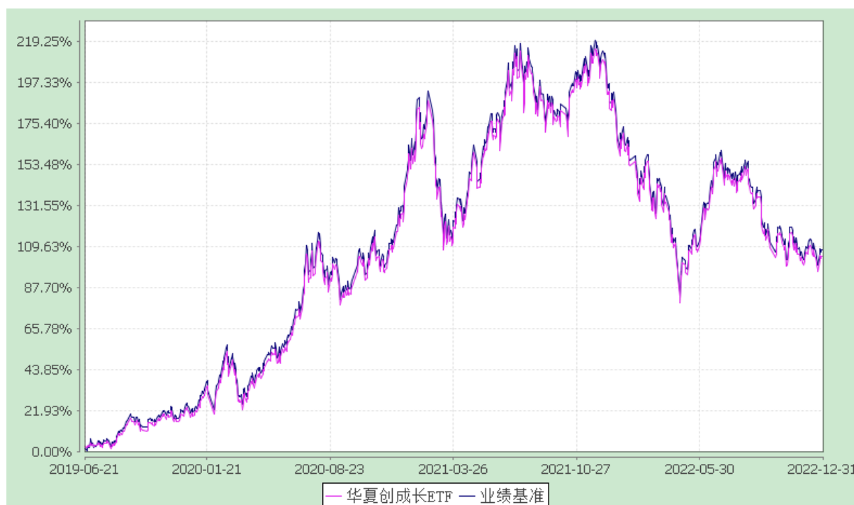
华夏创业板动量成长交易型开放式指数证券投资基金 份额累计净值增长率与业绩比较基准收益率历史走势对比图 (2019年6月21日至2022年12月31日)